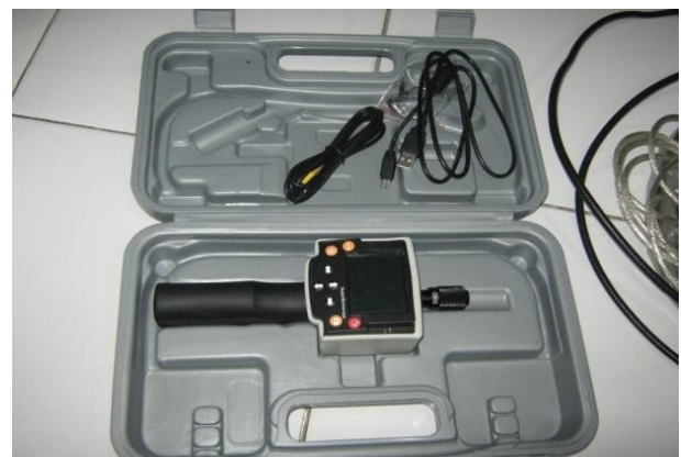
Kamera Pipa Boiler