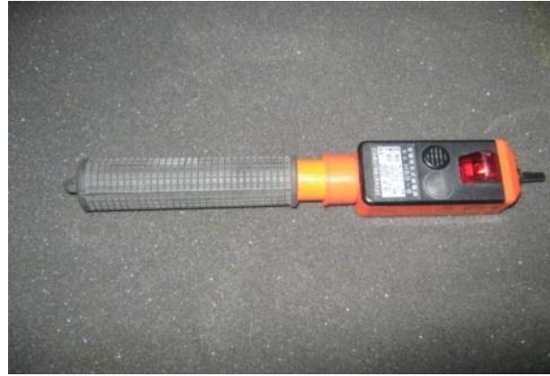
Deteksi Tegangan Listrik