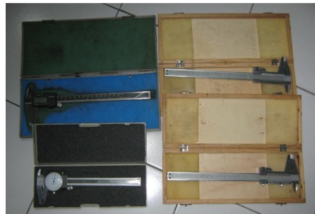
Manual & Digital Caliper