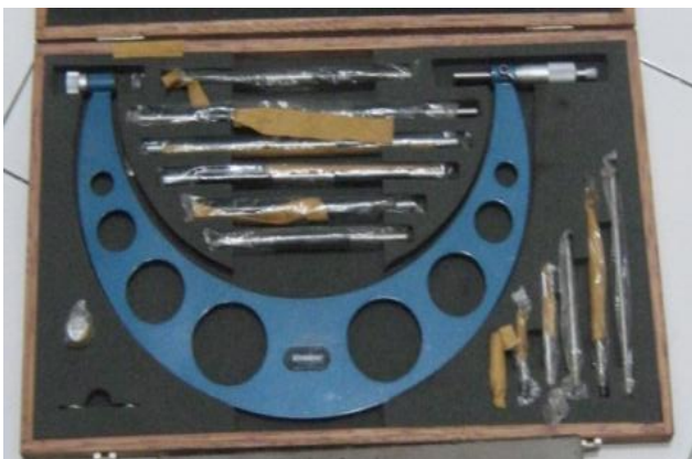
Micrometer (150 – 300 mm)